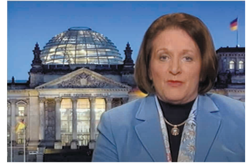
Berlin, nur Stunden später: Bundesjustizministerin Leutheusser-Schnarrenberger wirft der Kirche mangelnden Aufklärungswillen vor