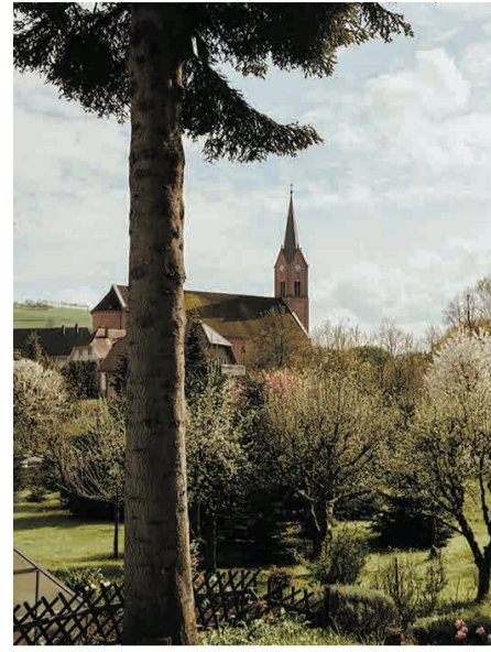
In Oberharmersbach missbrauchte ein Priester jahrelang Messdiener