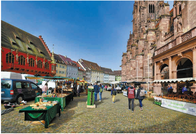
Freiburger Münsterplatz: Es hätte so idyllisch sein können auf der Versammlung der Bischöfe in der Heimat ihres Vorsitzenden Zollitsch