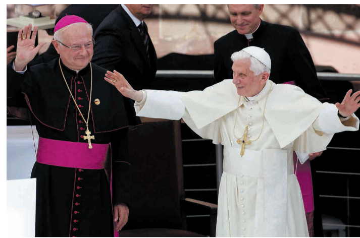
Als Benedikt XVI. in Freiburg mit Zollitsch die Messe feiert, ist das Thema Missbrauch fast vergessen