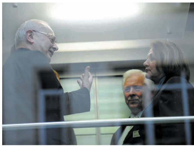
Im April 2010 treffen Zollitsch und Leutheusser-Schnarrenberger im Justizministerium zusammen