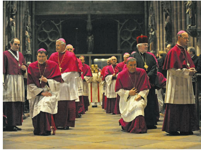
22. Februar 2010 im Münster: Schon die Eröffnungsmesse der Versammlung wird vom Thema Missbrauch überschattet