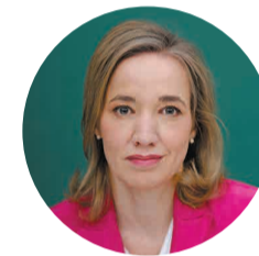
Die Debatte 2010

Kristina Schröder, CDU, früherer Bundesfamilienministerin