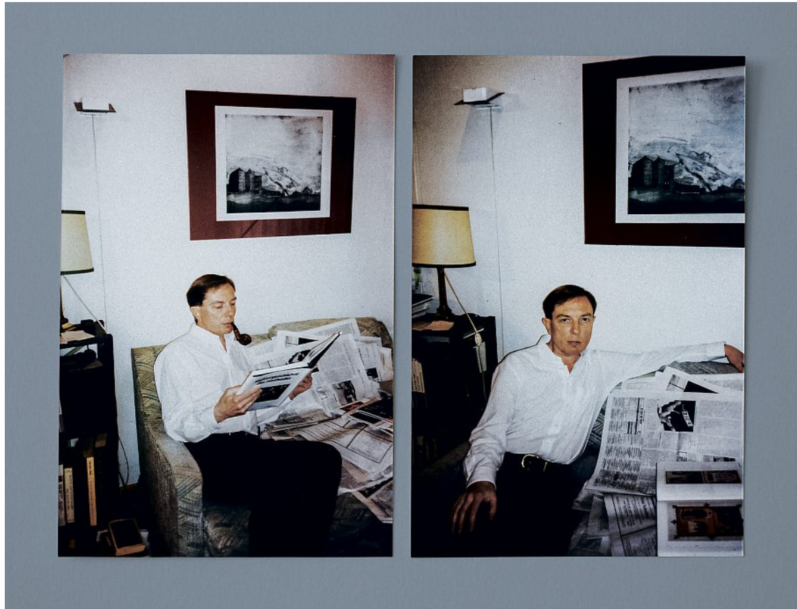
Diese Fotos nahm Michael Baumann wohl etwa 1995 per Selbstauslöser in seinem Wohnzimmer auf.

Ich finde einen weiteren Insider aus einer Gemeinde Leons. Er schätzte Leon sehr und war mehrmals mit ihm als Begleitperson in